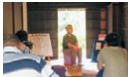
ようこそ!お話の世界へ