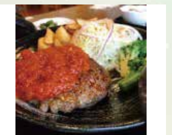
鹿肉と豚肉の合挽きハンバーグセット 1,600円