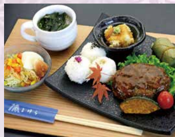
猪鹿ハンバーグ 2,030円