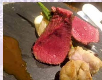
ジビエコース 13,200円 (写真は鹿肉のロースト)