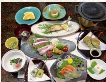
ジビエ山の幸会席 17,080円(平日) 17,580円(休日) (2名1室料金)