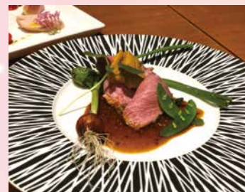
ならジビエコース 5,500円