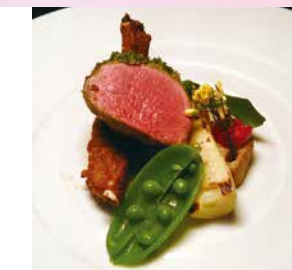
コース料理(鹿肉のロースト) ランチコース 3,960円～ ディナーコース 4,840円～