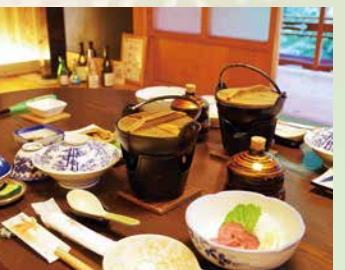
天川の味満喫御膳プラン (ぼたん鍋や鹿肉ローストなど) (1泊2食付) 13,500円～