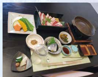
ジビエ焼き肉御膳 4,000円