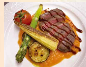
鹿肉のロースト 2,500円