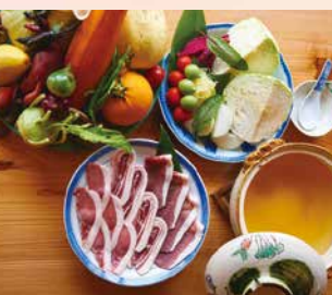
大和五條の猪鍋 6,000円