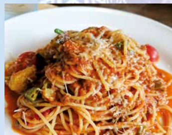
吉野鹿とお野菜のミートソース和えスパゲッティ 1,700円