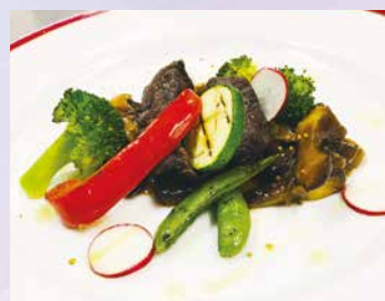
鹿肉のステーキ 2,640円