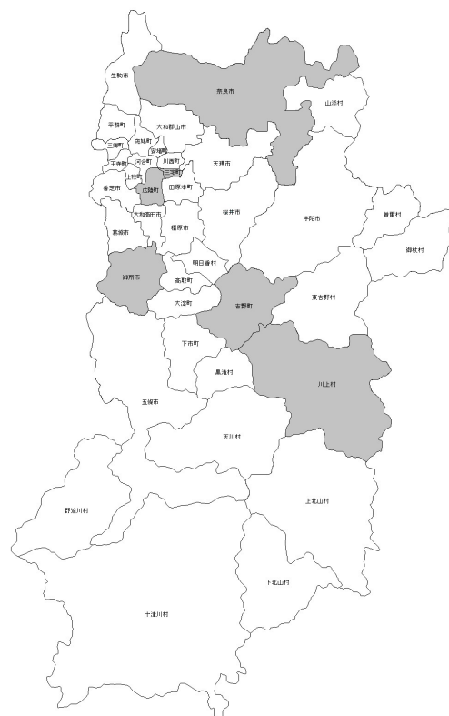
表 7 ダイオキシン類（土壌）調査結果（令和2年度）

一般環境として調査した7地点の平均値は2.89pg-TEQ/g、発生源周辺として調査した2地点の平均値は19.7pg-TEQ/gであった。