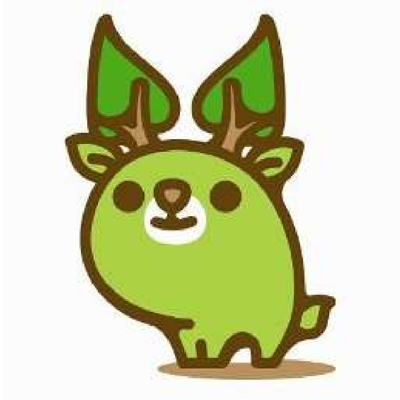
奈良県エコキャラクター な～らちゃん