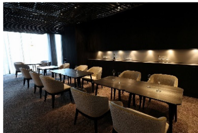
TOKiの内観(レストラン)