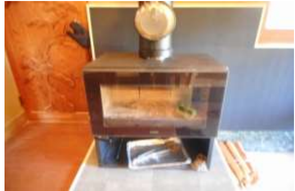
薪ストーブの設置（大淀町内）