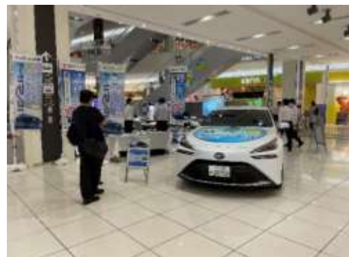
水素普及啓発イベントの実施