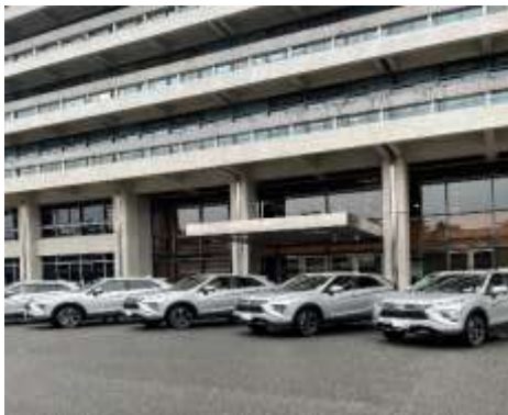
プラグインハイブリッド車5台の導入

また、燃料電池自動車MIRAIを奈良マラソンの先導車として活用する等FCVの啓発を実施しています。