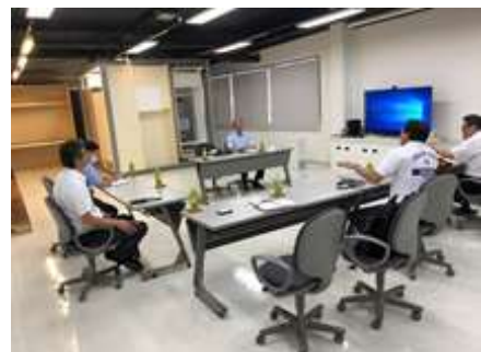
事業所へのアドバイザー派遣