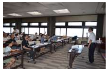
エネルギー教室の様子

令和5年8月に、関西電力送配電株式会社及び関西電気保安協会の協力のもと、子ども達に小さい頃からエネルギーの大切さを認識してもらう狙いで、県内在住の親子を対象に、省エネや再エネに関する普及啓発教室を実施しました。午前午後と約70名の方に参加していただき、くらしと電気エネルギーについて学んでいただきました。