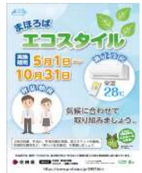
まほろばエコスタイル普及啓発ポスター

一般的に、夏季・冬季には多くの電気を使うことから、電力需要の高まる季節にあわせ、遮熱・断熱による屋内温度の維持や、クールシェア・ウォームシェアなど家庭でできる省エネの取組に関して、ポスターを作成し普及啓発を図りました。