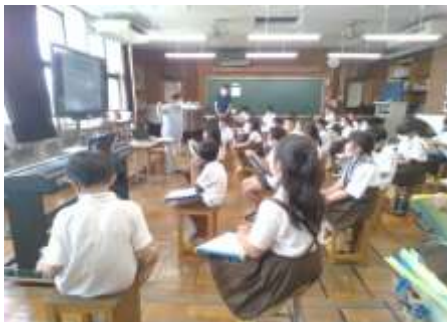
小学校へのアドバイザー派遣