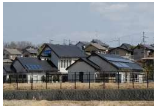
福祉施設への太陽熱利用システムの導入