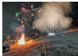
※実際の見え方と異なります。

時 1月27日(土) ¥0 無料 申込不要 大花火 18時15分 点火 18時30分 所 若草山(奈良市)