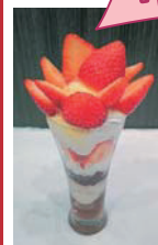
奈良のうまいもの プラザ