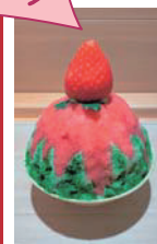
奈良まほろば館 Cafe&Bar まほろ