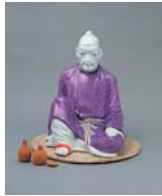
大有田焼振興協同組合 《万葉歌人陶磁器人形 大伴旅人像》

万葉集を代表する7人の歌人にスポットをあて、当館のコレクションを紹介いたします。