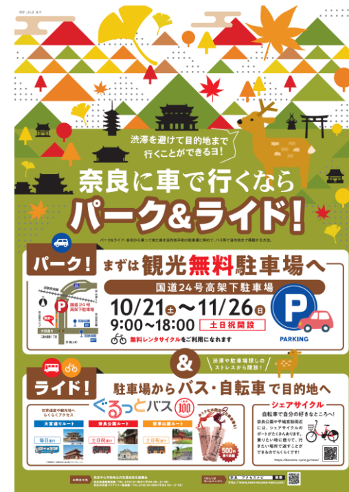
図. P&Rポスター（令和5年秋期）