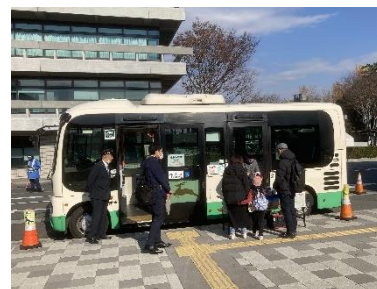
実走実験（奈良公園バスターミナル）