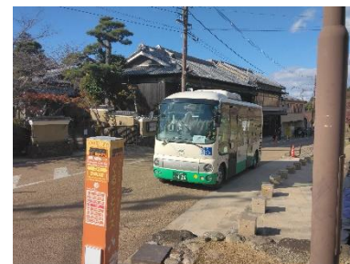
実走実験（若草山麓バス停）