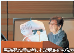
最高感動賞受賞者による活動内容の発表