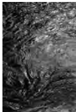
山本紉《津風呂ダム 2》2023年 一部分

所 芸術文化体験棟 「宇宙の力が可視化される」として、さまざまな水の姿を撮影する写真家・山本紉さん。県内で撮影した新作を展示します。