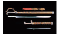
飾り大刀・飾り剣(復元) 藤ノ木古墳出土 当館蔵

一般 400(350)円 大・高生 300(250)円 中・小生 200(150)円