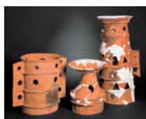
東殿塚古墳の埴輪 天理市教育委員会蔵

所 文化財修復・展示棟 これまでの調査成果を通じて、天理市の古墳時代を代表する大和古墳群・柳本古墳群を紹介いたします。