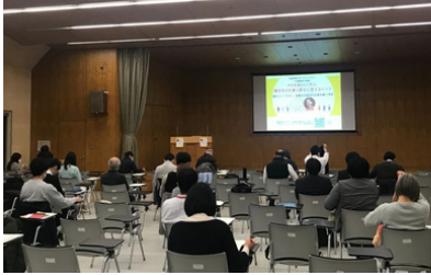
これまでの様子 (2016年3月19日、2021年3月11日開催)