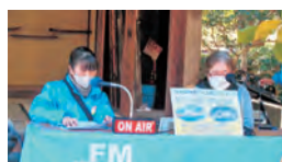
民博・健活・昼活トーク