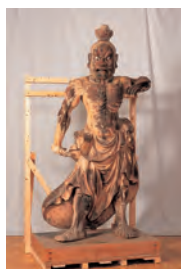
當麻寺仁王像 (阿形像)

文化村修復工房で令和4年5月から 修理を行った當麻寺仁王像(阿形 像)の修理完成記念展示です。修理 内容や修理中の知見も併せてご紹 介します。