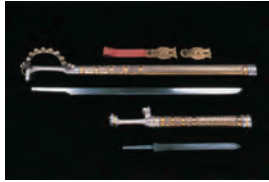
飾り大刀・飾り剣(復元) 藤ノ木古墳出土 当館蔵

一般 400(350)円 大・高生 300(250)円 中・小生 200(150)円 東吉野村に鍛刀場を営む 刀匠・河内國平さんは、藤ノ 木古墳出土刀剣や石上神