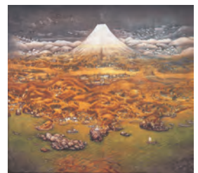
不染鉄(山海図繪(伊豆の追憶)) 大正14(1925)年 公益財団法人 木下美術館蔵