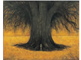
不染鉄(いちよう) 昭和40年代 個人蔵

当館ではこれまで1996年と 2017年の2度にわたり回顧 展を開催しましたが、再度の 開催を待ち望む声を受け、初 期から晩年までの代表作の 展示により、魅力を改めて顕 彰します。