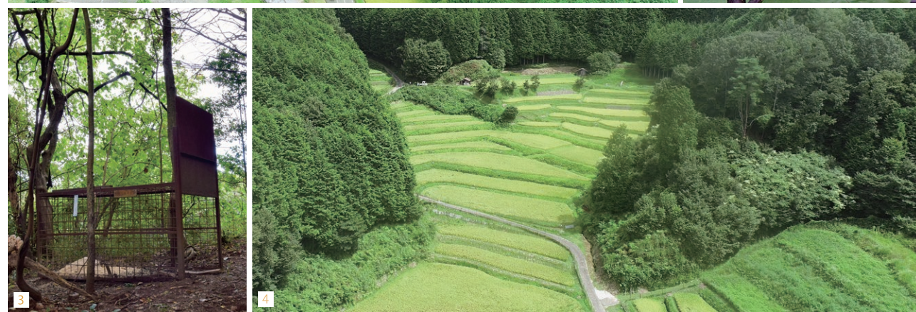
1. 大慈仙では、田んぼのほか茶畑も見られます。2. 特産品の大和丸なす。エコファーマーの大西さんほか、3件の農家で生産されています。3. 獣害対策用の箱罠。地区内 20か所に設置され、猟友会の方々が毎朝確認しています。中には餌として糠が入っています。4. 森の中に広い面積で保全されている棚田。