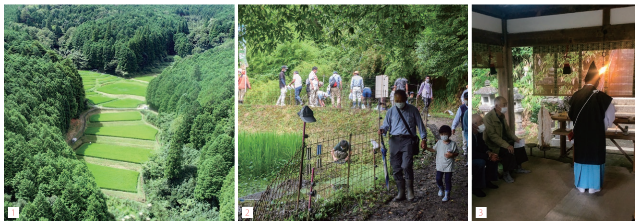
1. 青々と生い茂る森に囲まれた棚田。2. 棚田のそばを大人も子供もハイキング。3. 恩田（おんだ）祭、野休み、風の祈祷、秋祭り、新嘗祭等年間通じて豊作や住民の健康、地域の安寧を祈り、神事が素盞鳴尊社で執り行われます。

多くの棚田が森林に囲まれ、幻想的な風景が広がる忍辱山。大柳生地区の中で最も早く棚田の維持・保全に向けた計画を作成し、新たな取組を模索しています。