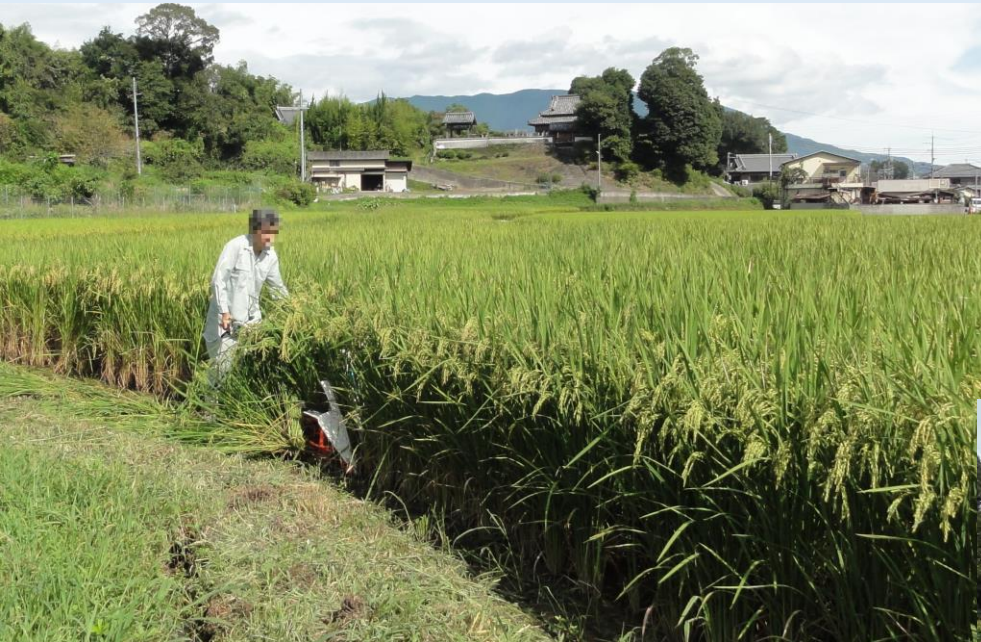
額縁部分の刈倒し（バインダー）