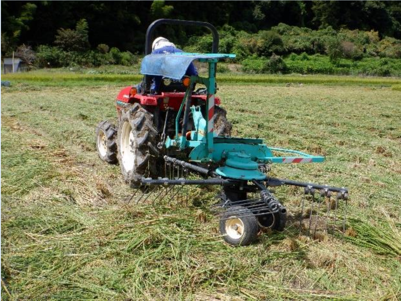
レーキによる攪拌