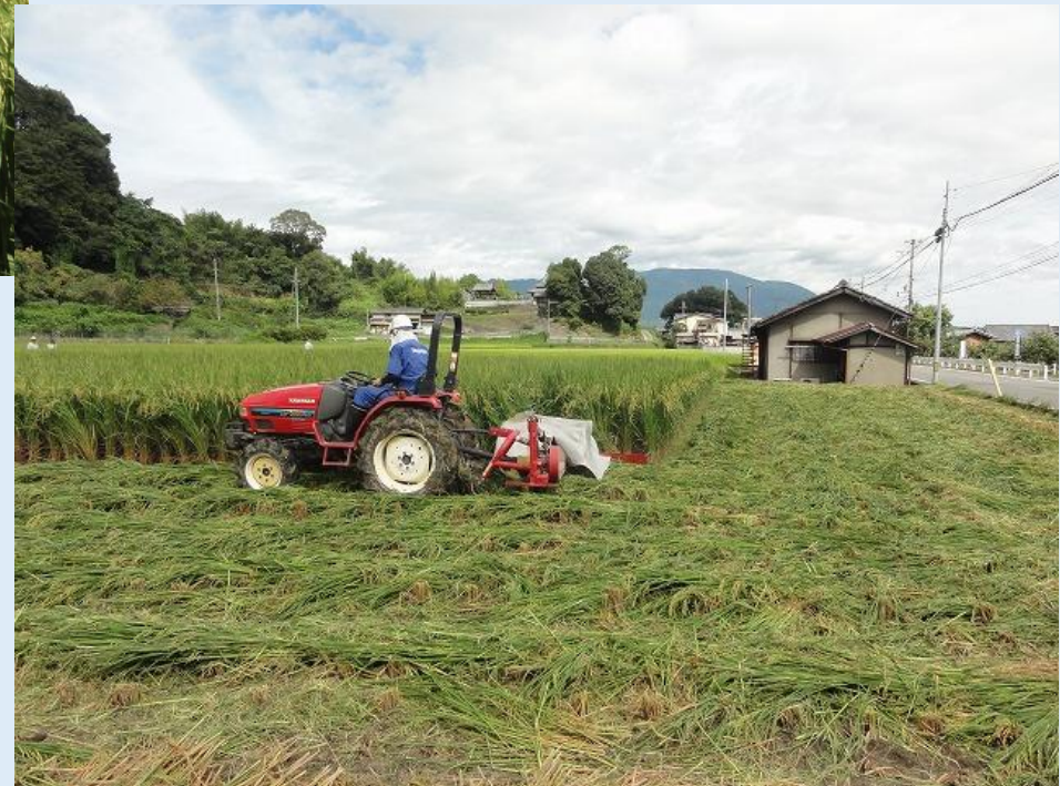
モアによる刈倒し