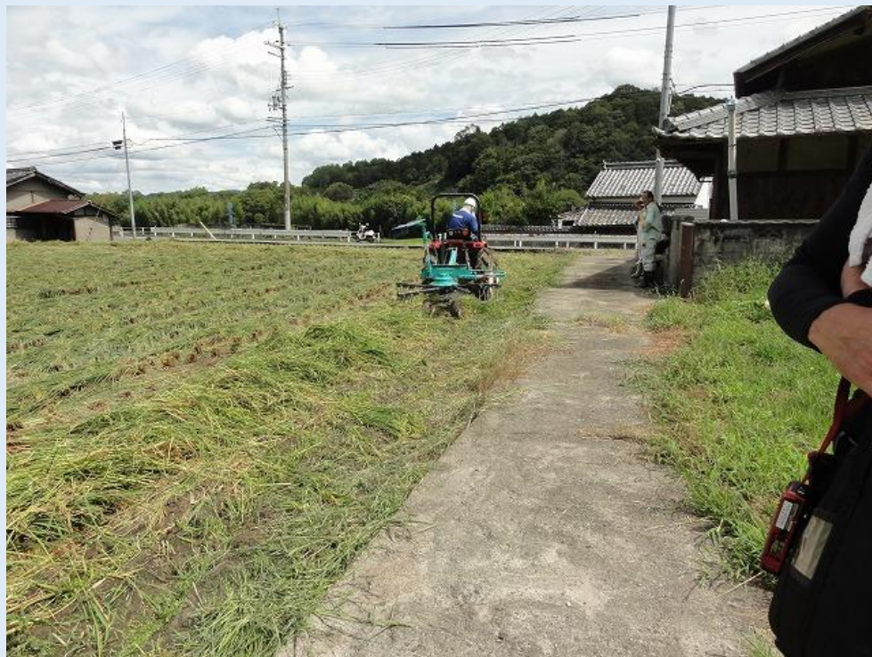
レーキによる集草