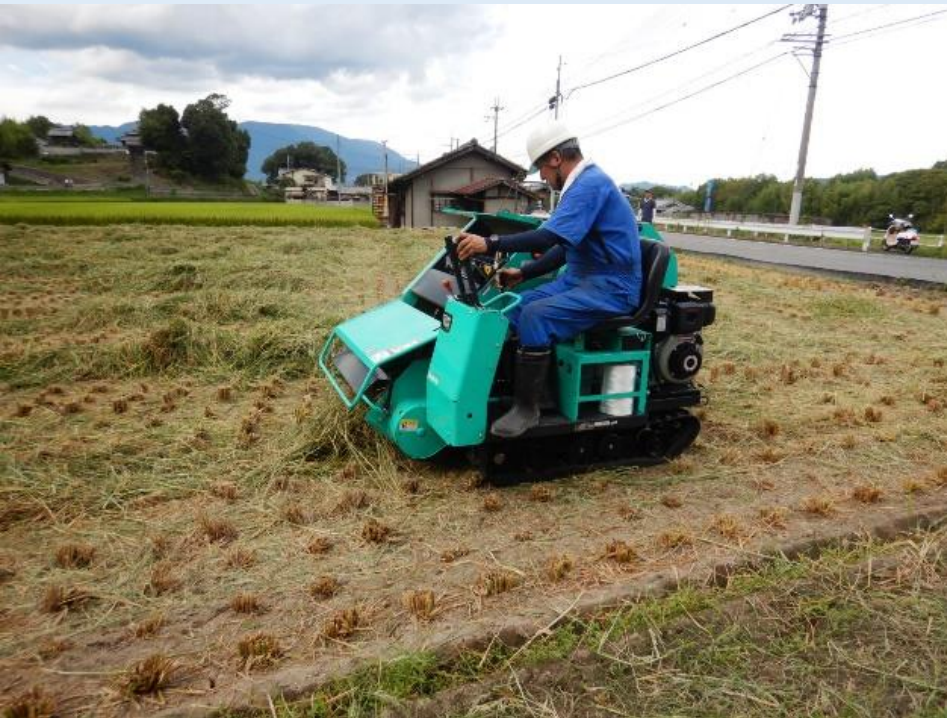
ロールベラーによる作業