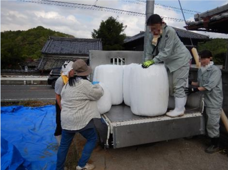
軽トラへの積み込み