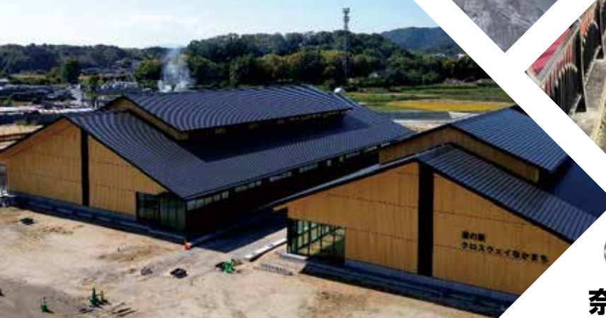
道の駅「クロスウェイなかもち」(整備中)