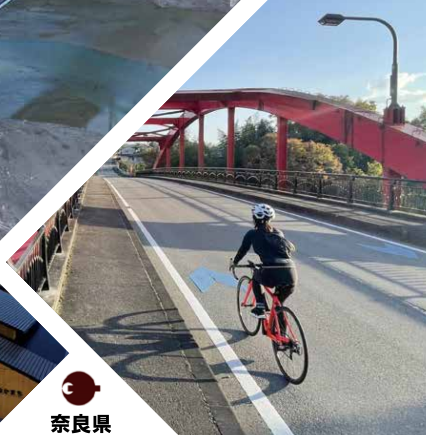
京奈和自転車道(栄山寺橋)