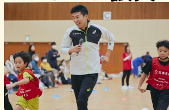
日本生命所属の桐生祥秀選手 によるかけっこ教室(2022年実施)