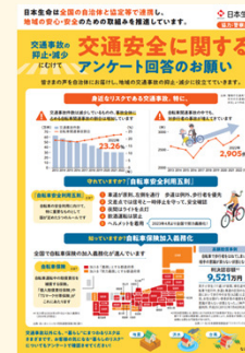
交通安全啓発チラシ