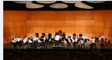
奈良ジュニアオーケストラ

・未来の芸術家を奈良の地で育む ”Nara for Culture”プログラムへの協力