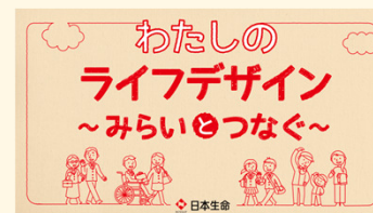
ライフデザイン教育