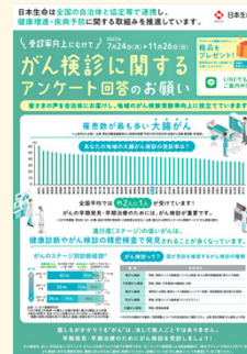
がん検診啓発チラシ