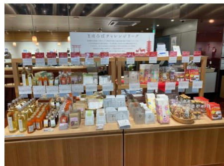
昨年度実施の様子

各回10社程度 (第1回:「奈良のお土産物」食品5社、非食品5社を想定) (第2回:食品5社、非食品5社を想定)