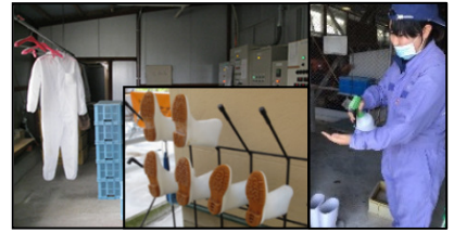
専用の服や靴の使用、手指消毒