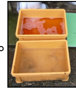
推奨される踏込消毒槽の設置方法！