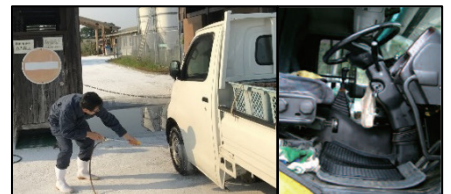
車両はタイヤだけでなく、 泥よけの内側 まで消毒し、 フロアマットの交換 や ペダル等車内も消毒