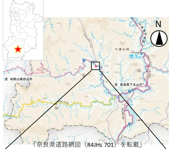
「奈良県道路網図 (R4Jhs 701)」を転載