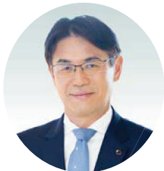
奈良県知事 山下 真