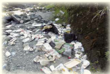
バーベキューごみの不法投棄