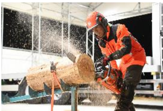
← チェーンソー 操作実習の様子