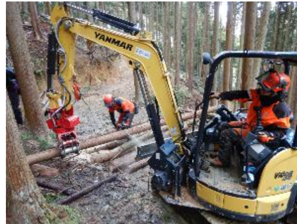
→ 木材の搬出実習の様子