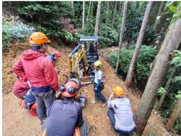
← 作業道の開設実習の様子

林業に必要な資格の取得はもちろん、安全に木を伐倒したり道づくりを行う技術等について、森林内での実習を通じて学習。(運営財源:奈良県森林環境税) また、企業でのインターンシップや学生向けの就職斡旋も実施。