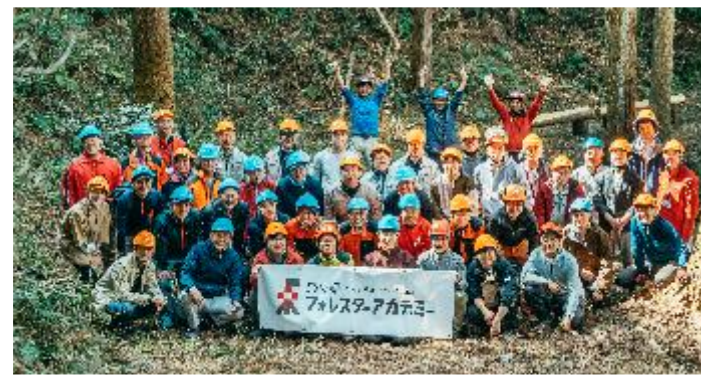
→ 実習後の集合写真