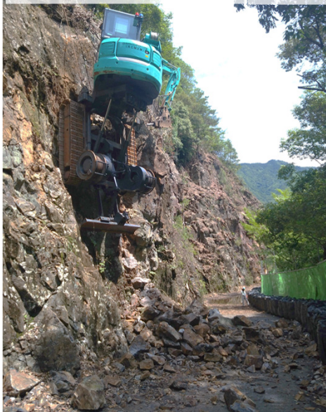
不安定岩塊の掘削状況 R6.6.19