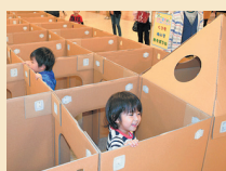
巨大めいろ イメージ写真

当館研究員や学芸員による子どもを対象とした夏休みイベントのほか、「コンサートや巨大めいろも登場」詳細は決定次第HPに掲載します。