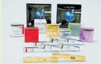
中国無錫工場生産品

研修生受入をきっかけに中国にパッケージの生産拠点を設立。日本の高品質基準にて一貫した生産体制を整備することで販路を拡大し、現地企業から多数の表彰を受賞。