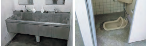
現在の県立高校のトイレ