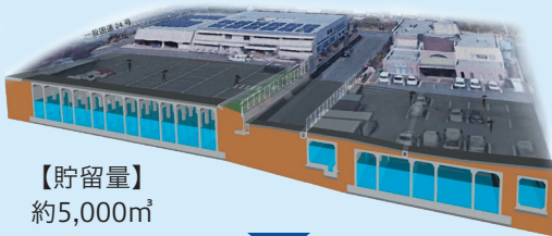
【貯留量】 約5,000m 3

田原本町が整備した雨水貯留施設が初めて稼働。総雨量で176mmを観測しましたが、貯留施設の流域内では浸水被害は発生しませんでした。