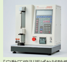
「自動圧縮引張ばね試験機 PROシリーズ 卓上型タイプ」

中国、台湾、シンガポールなどの代理店と連携し、高品質のばね試験機を海外に展開。海外代理店教育に力を入れることで現地顧客への保守点検、アフターフォロー対応を強化。