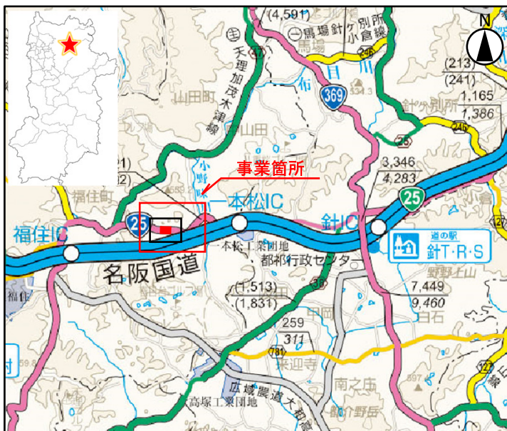
「奈良県道路網図(R5JHs506)を転載」