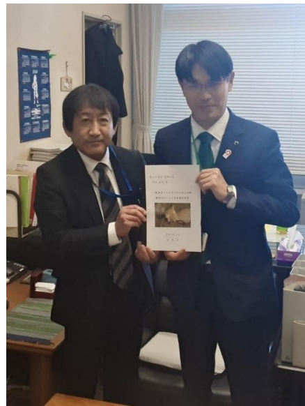
丹羽道路局長へ 権限代行を要望