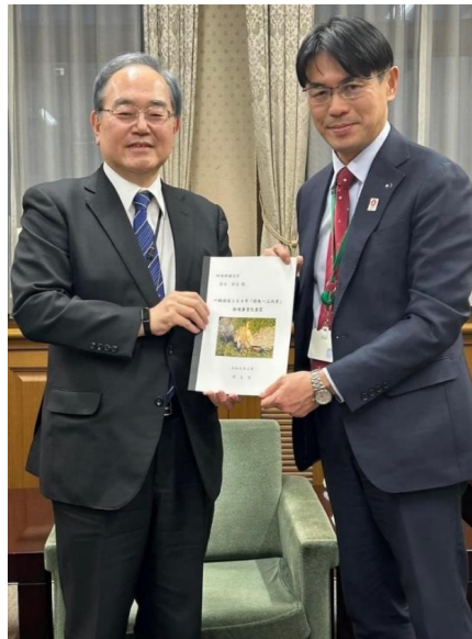
茶谷財務事務次官へ 権限代行を要望