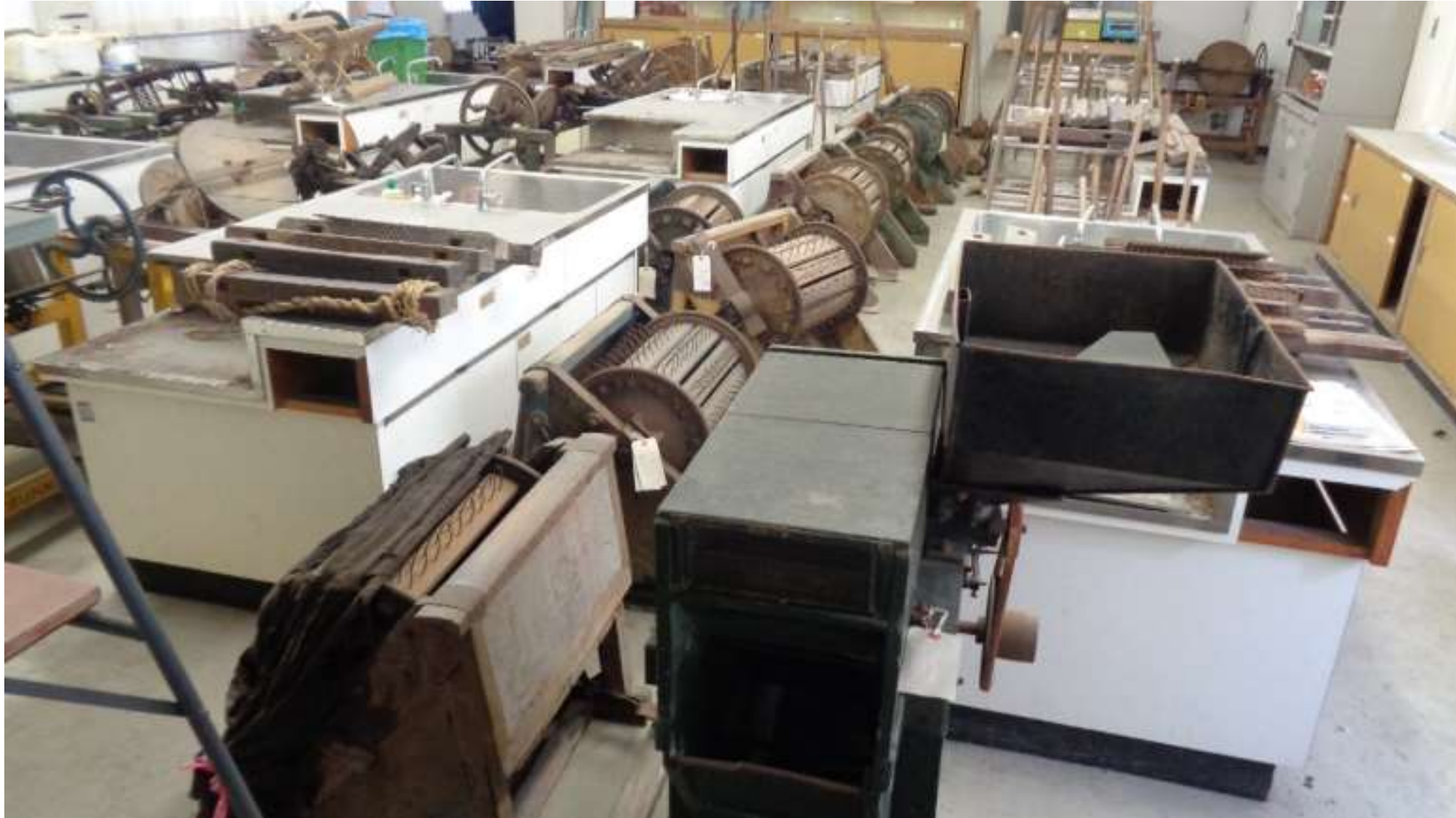
足踏み脱穀機など(収穫した稲穂から粃を落とす道具)