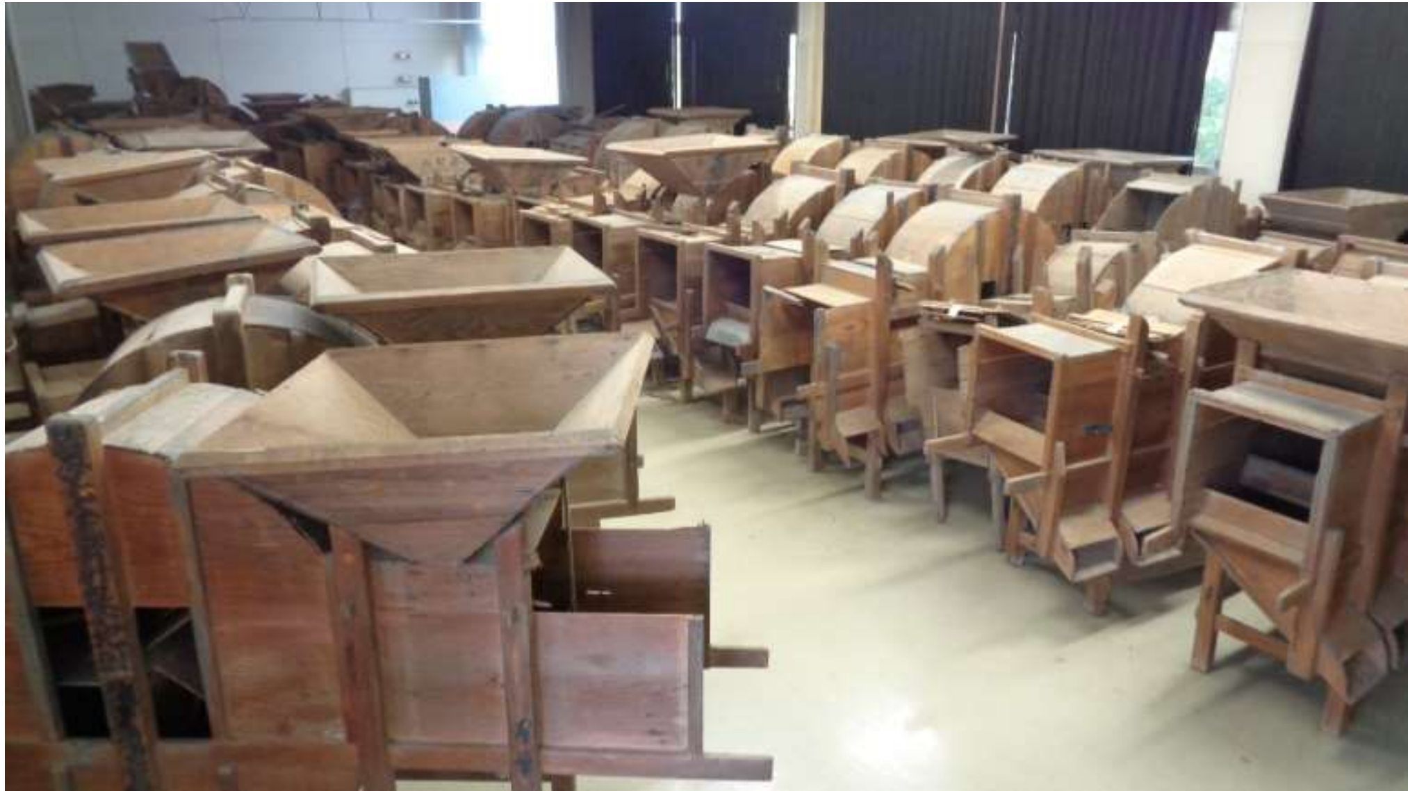
唐箕(とうみ)(穀物を上部逆三角から通し、風力で砂や塵などと分離する)