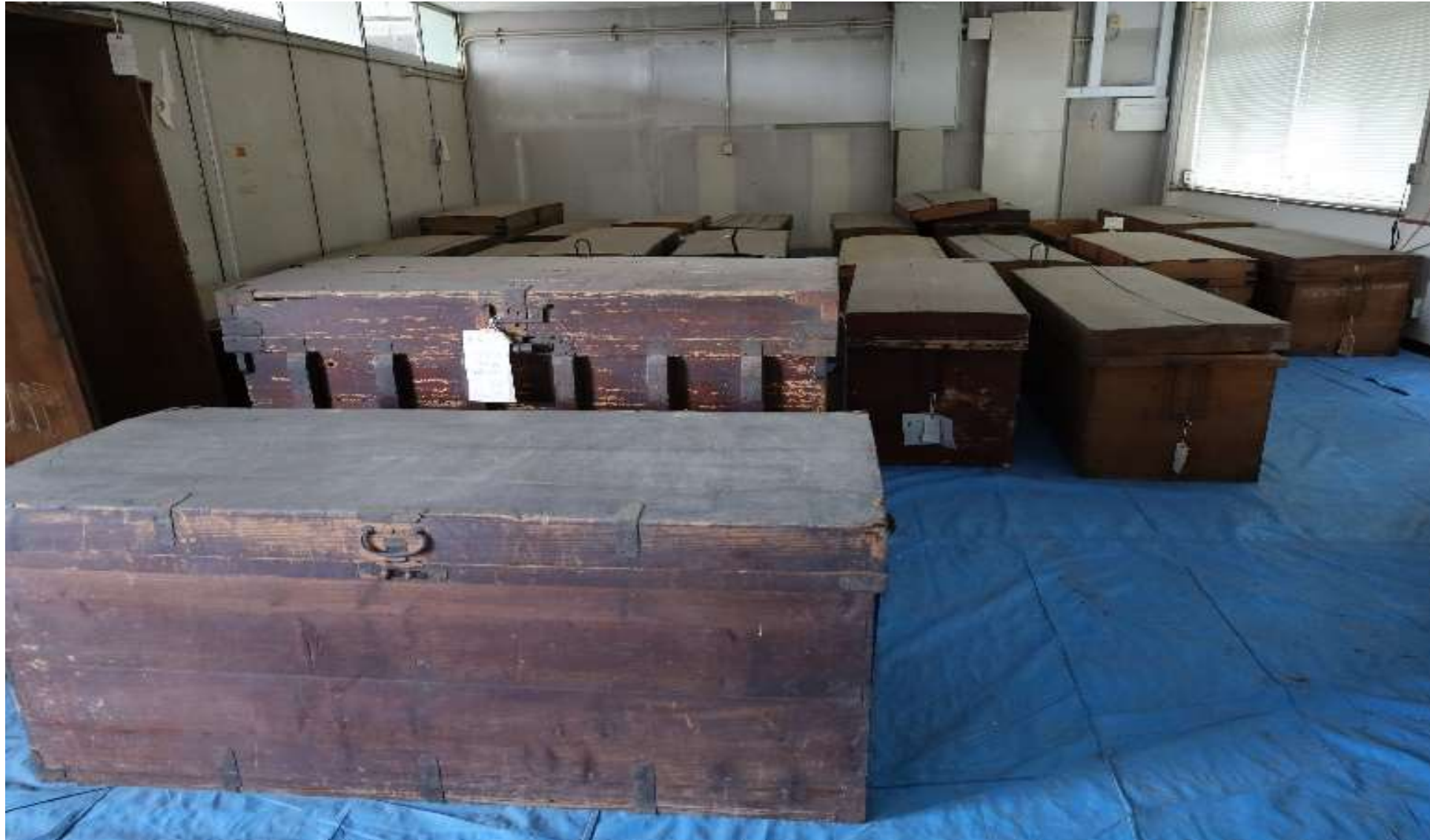
長持(ながもち) (衣類や寝具の収納に使用された長方形の木箱)