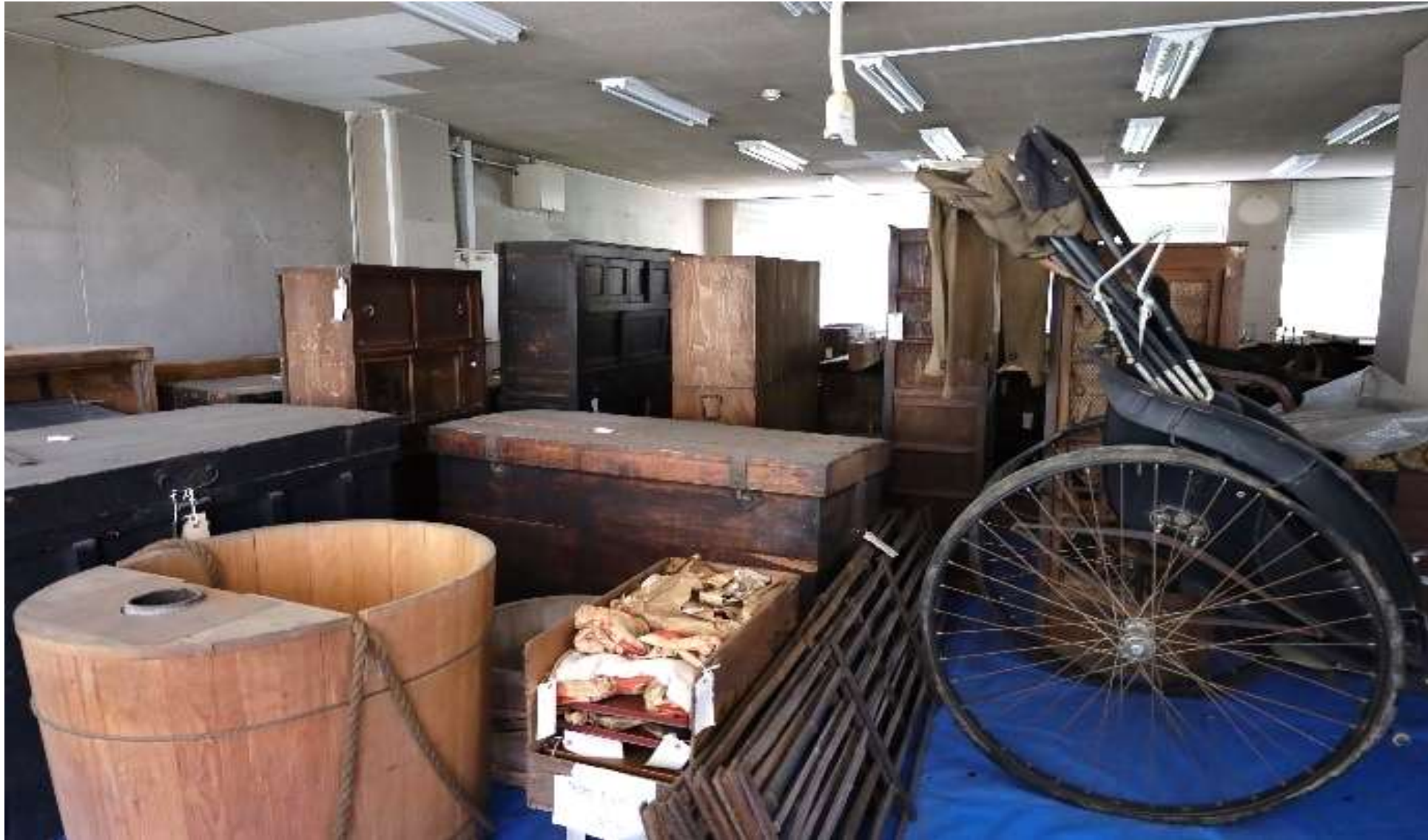
鉄砲風呂、人力車など（鉄砲風呂…火を燃やしてお湯を温める釜が付属している風呂桶）