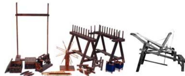
II. 木綿の用具 II-A. 製綿用具