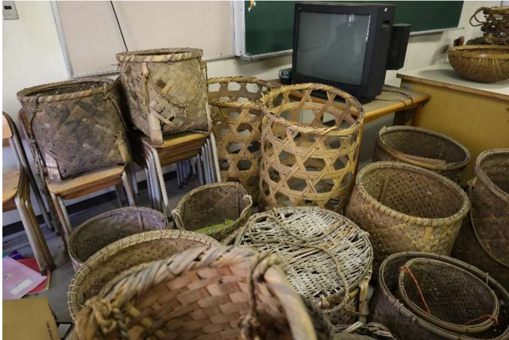
竹カゴ(竹で出来たカゴ。収穫した作物を運ぶためなどに用いられる。)