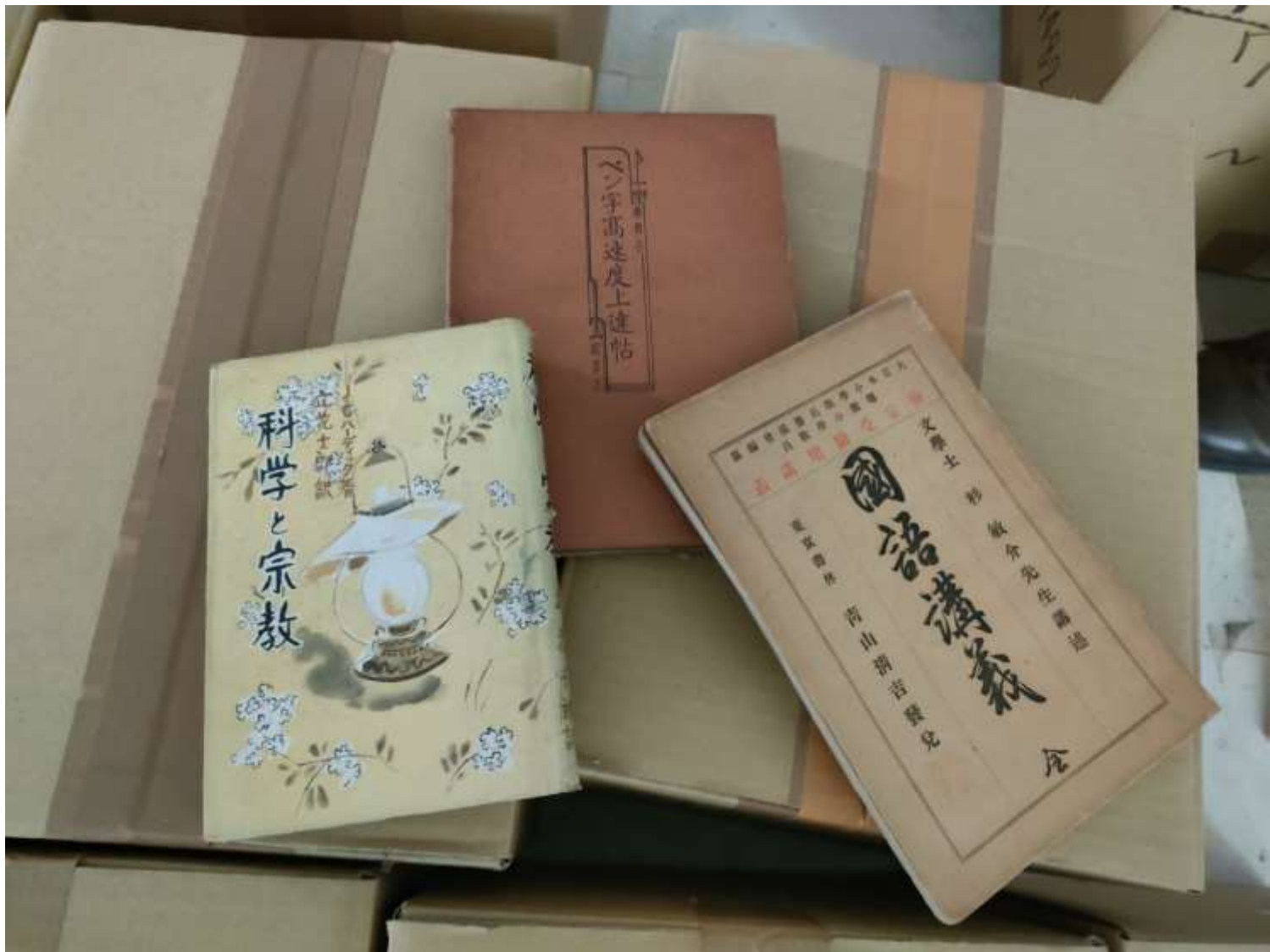
書籍(明治~昭和初期)