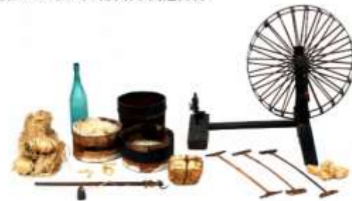
I. 奈良晒の用具 I.A. 産材科丸のI.B. 製糸用具