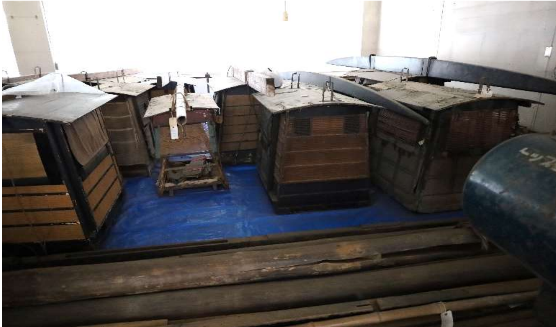
駕籠(かご) (棒の両端を人が担いで人を運ぶ乗物。乗る人物の身分などによって使用できる種類が分かれる。)