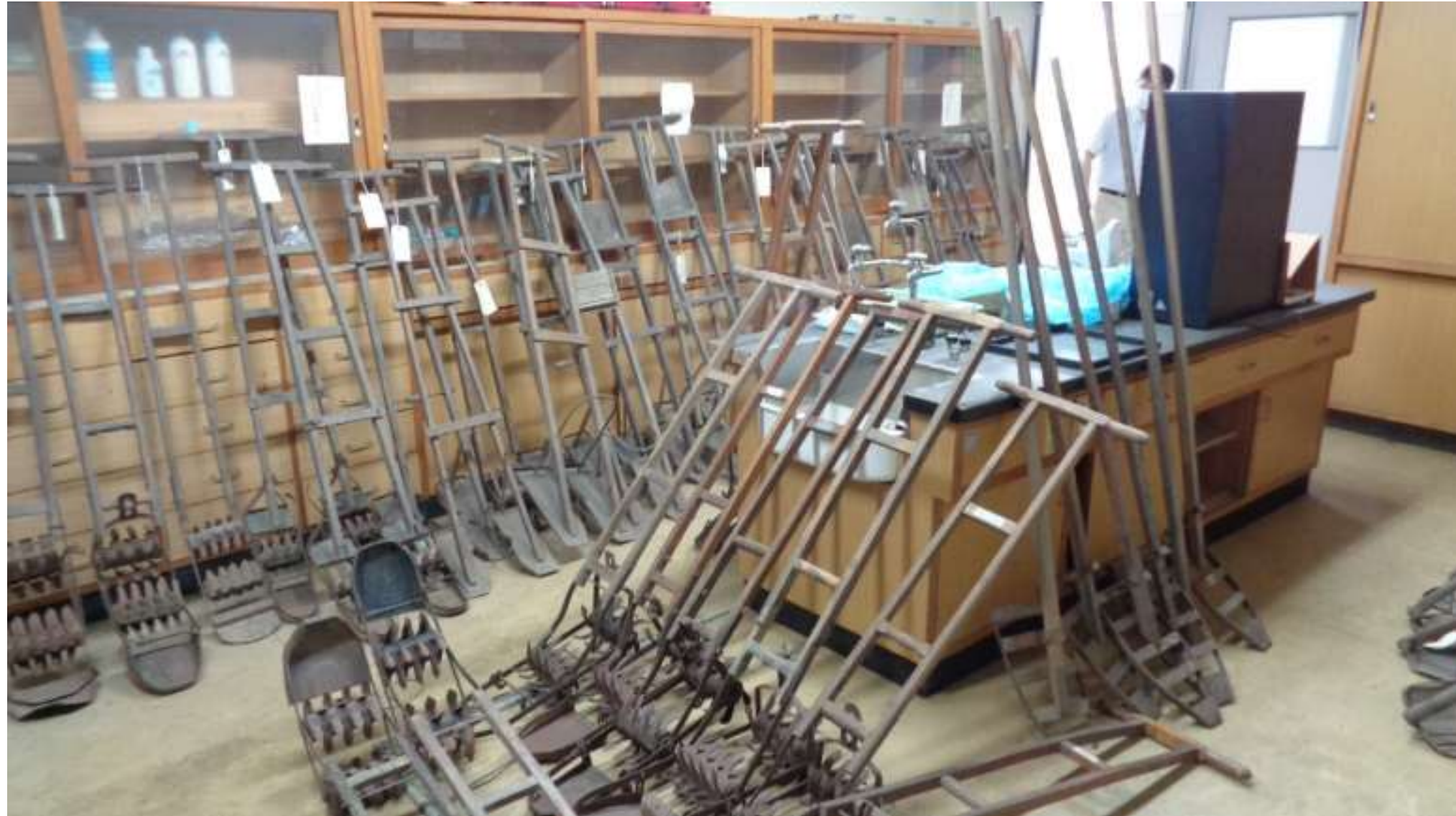
除草機(水田の中の雑草を刈る道具)