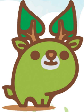
奈良県エコキャラクター な〜らちゃん

講座や工作・実験を通じて、 再生可能エネルギー、省エネルギー、 水素エネルギーについて、 見て・ふれて・学べる 2つのイベントを開催します。