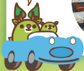
前回の水素イベントの様子