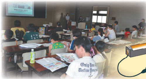
前回のエネルギー教室の様子