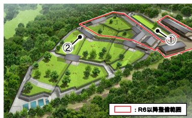
飛火野周辺地区(鹿苑)整備イメージ