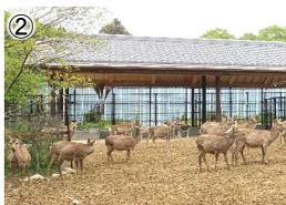
② 鹿の給餌施設(R5整備箇所)