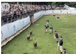
① 鹿の角きり [秋を彩る奈良の伝統行事]

○奈良公園の価値を維持し、更なる魅力の向上のため整備を推進。 ○飛火野周辺地区(鹿苑)では、天然記念物「奈良のシカ」の保護・ 育成施設を整備。