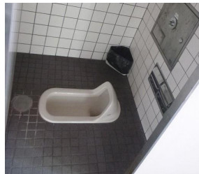
トイレの洋式化および、おむつ交換台、オストメイト対応のバリアフリートイレの整備。