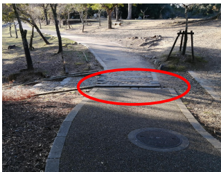
ベビーカーが通りにくい段差やすき間を解消。