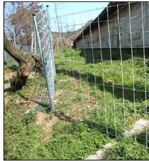
<野生動物侵入防止フェンス>