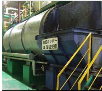
<エコフィード処理設備> 農林水産省 令和元年度 「エコフィード全国セミナー」資料より