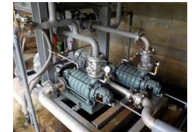
揚水ポンプ(大和高原南部地区)