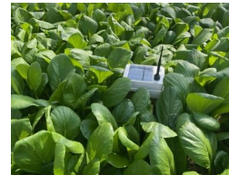
スマート農業機器(栃原地区)