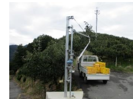
給水スタンド(栃原地区)