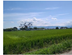
ドローンでの作業(百済川向地区)

儲かる農業ゾーンの目標を達成するために必要な基盤整備を国庫補助事業により実施中。 調査・調整費の活用により、担い手育成を支援。