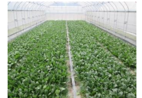
有機ハウス栽培(伊那佐東部)