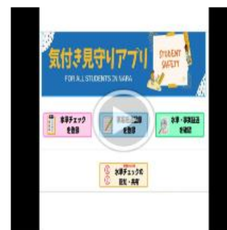
効果的な運用の工夫