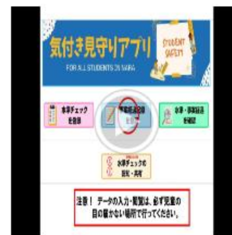
事案経過記録の入力