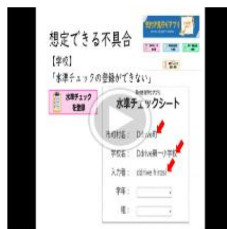
想定される不具合とその解決方法