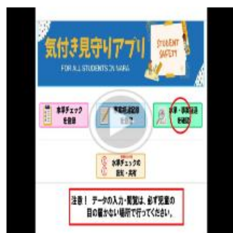
事案経過記録の閲覧