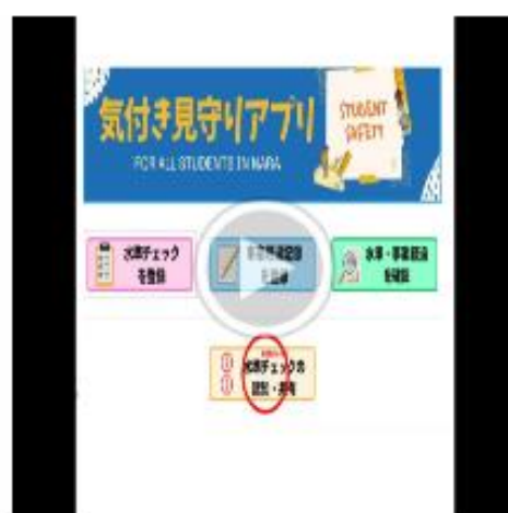
いじめ認知・報告