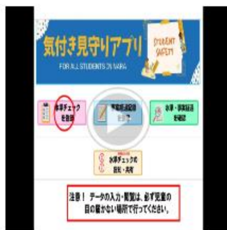
水準チェックの入力