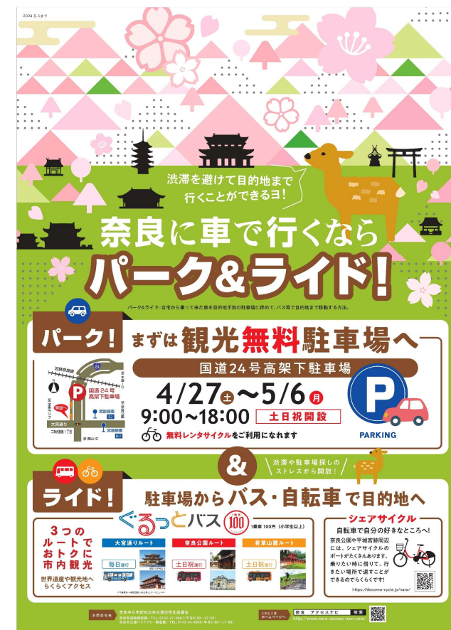
図. P&Rポスター（令和6年春期）