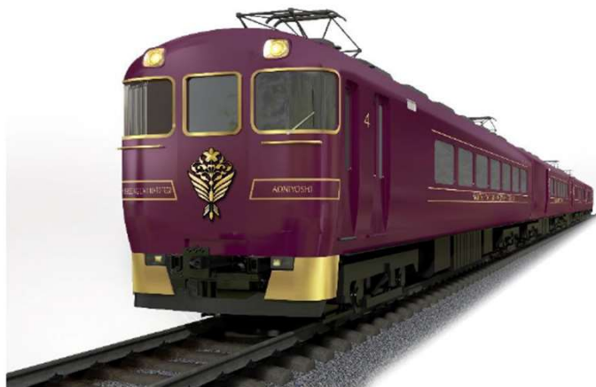
観光特急「あをによし」（近畿日本鉄道）