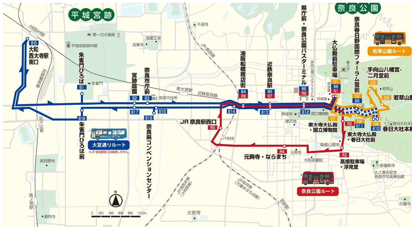
図. ぐるっとバスの運行概要（令和6年秋期）