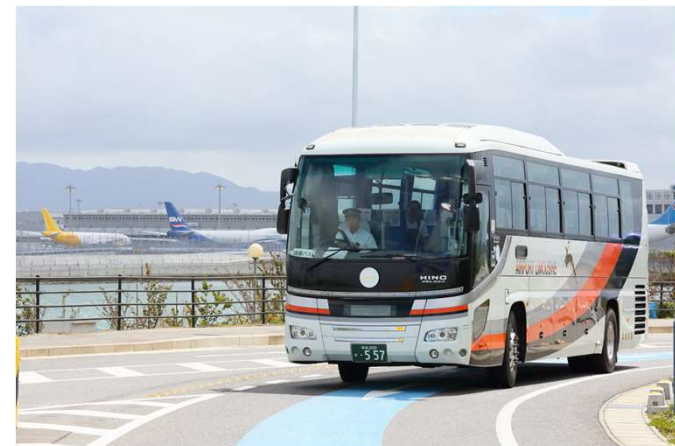
空港リムジンバス（奈良交通）