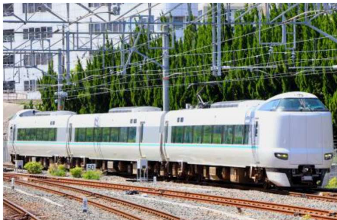
臨時特急「まほろば」（JR西日本）