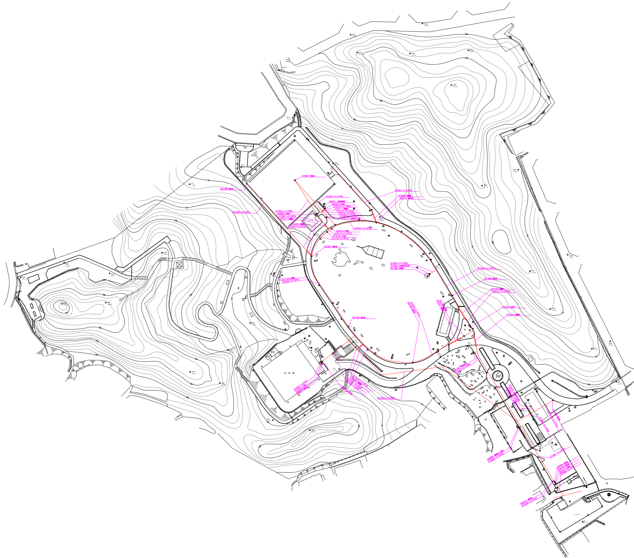
給水施設平面図(東地区)