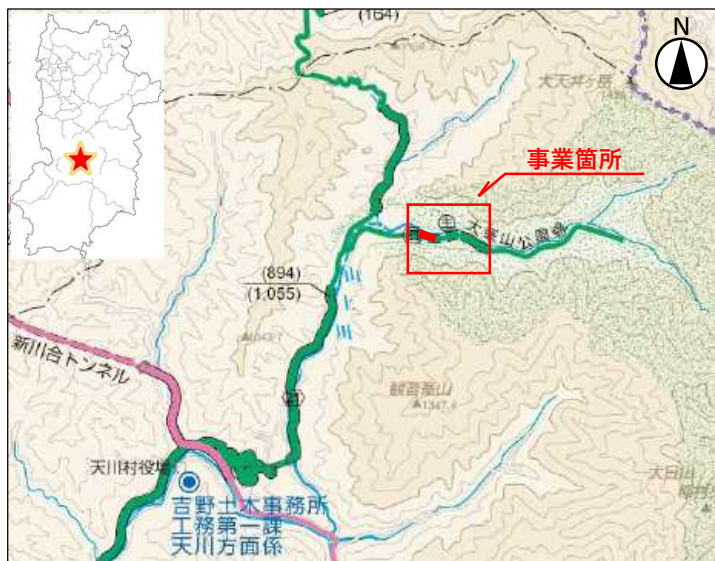
「奈良県道路網図(R5JHs506)を転載」