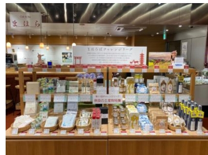
今年度第1回実施の様子

例 職場で、家庭で、色んな場所で働く人へ。ご褒美食品、お菓子、プレゼント、癒やし、お役立ち、便利商品など、働く人へ伝えたいストーリー性のある商品。 (「働く人の心に響く奈良の商品」として売り出したい商品又は、イメージできる商品であること。)