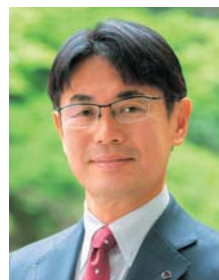
奈良県知事 山下 真

一方、豪雨等の気候変動の原因とされている地球温暖化を食い止める根本的な対策として、脱炭素の取組を進めなければなりません。県では9月に脱炭素戦略の骨子(※2)を取りまとめました。県民の皆さまに協力していただきたい取組もありますので、ぜひご覧ください。