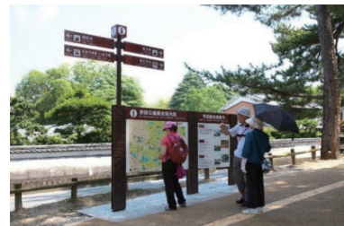
▲ 観光案内サインの設置(奈良公園周辺)

観光地内の回遊を促進するため、歩行者や自転車が快適に通行できる環境を整備します。