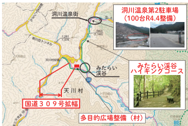
▲ みたらい渓谷にアクセスする国道309号の整備(天川村)

骨格幹線道路ネットワークから主要な観光地へ良好なアクセスを確保するための道路整備を推進します。また観光渋滞の緩和に向け、渋滞対策や公共交通の利用促進、新技術を活用した交通マネジメントを推進します。