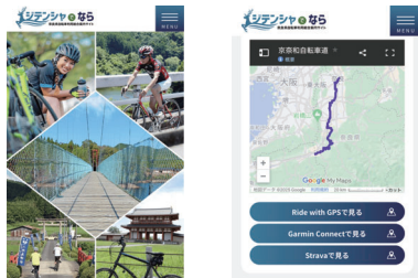
▲ 「ジテンシャでなら」奈良県自転車利用総合案内サイト

道路案内標識の英語表記の改善等ソフト施策を実施し、県内の世界遺産等を周遊観光できる環境整備を推進します。また自転車による周遊観光を促す環境づくりを推進します。