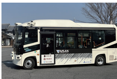
▲ 自動運転車両を用いた移動支援サービス(明日香村実証実験)