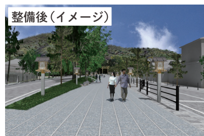
▲ 大神神社の上品な参道づくりと三輪のまちの賑わい創出

生活空間での歩行者・自転車利用環境の向上や無電柱化を推進し、周辺道路の一体的整備に取り組めます。