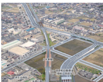
▲ 京奈和自動車道(仮称)奈良ICとJR新駅の交通結節点機能を活かしたまちづくり

バスターミナルや駅前広場等での乗継ぎ、乗換えの利便性向上を図り、周辺の回遊まちづくりを推進します。