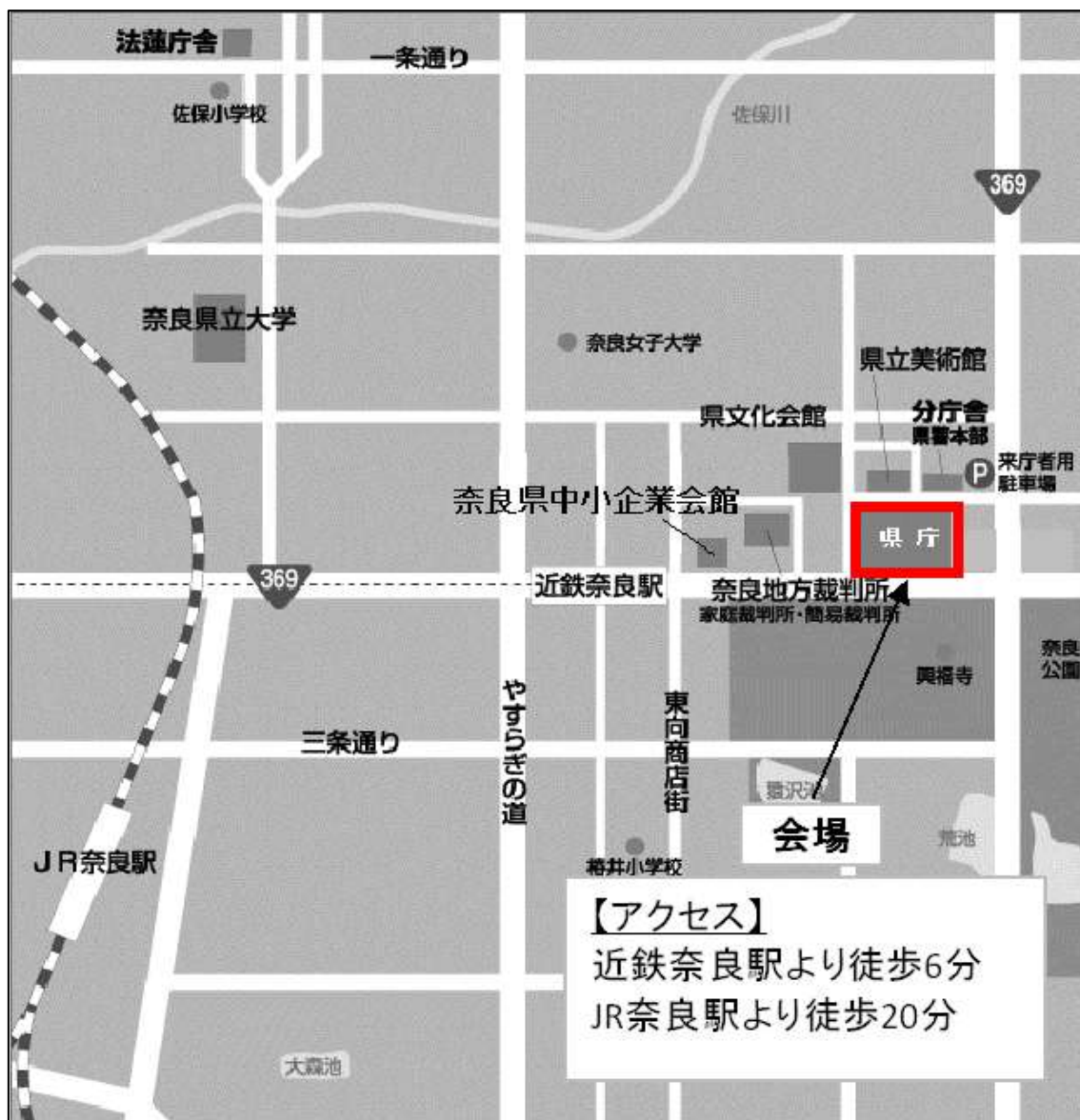
○第二次選考会場の位置図