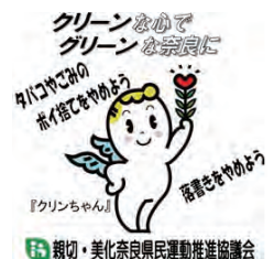
親切・美化奈良県民運動推進協議会