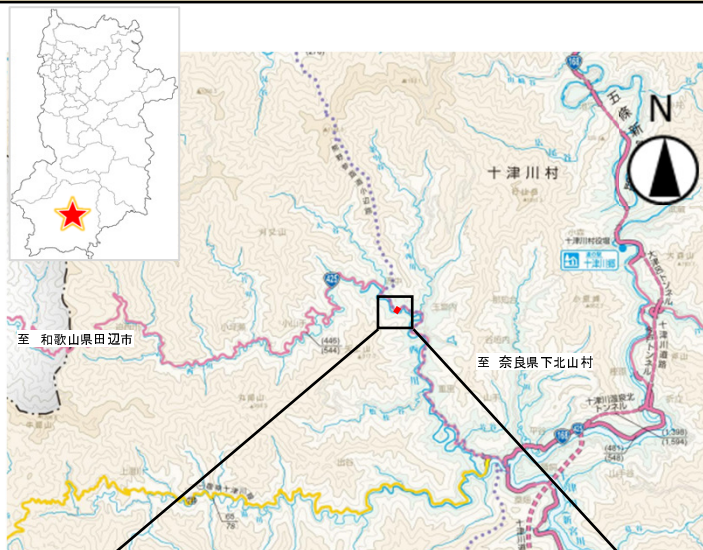
「奈良県道路網図 (R5JHs 506) を転載」