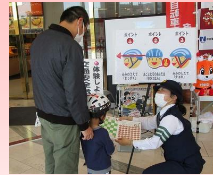
▲ヘルメット着用促進等に向けた交通安全普及啓発活動

「奈良県自転車の安全で適正な利用の促進に関する条例(令和元年)」や「第11次奈良県交通安全計画(令和3年)」に基づき、交通安全に関する普及啓発活動の一環として、ヘルメット着用促進に向けた広報啓発を実施します。