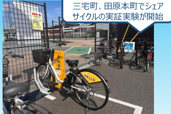
▲石見駅前のサイクルポート