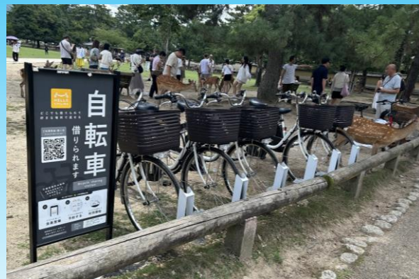
▲奈良公園内のサイクルポート

公共交通機関（鉄道、路線バス等）やサイクルステーション等からの利用を踏まえ、公共用地や鉄道駅周辺へサイクルポートを設置するため、各施設管理者へ働きかけを行います。