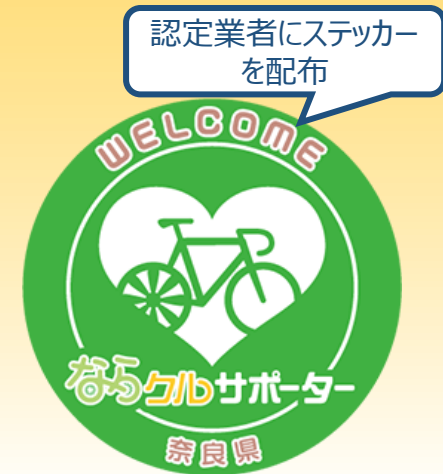
▲ならクル・サポーター認定マーク