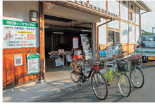
明日香レンタサイクル

明日香村は、古墳や神社・寺院、ミュージアム、石造物など、日本のはじまりの地ならではの見どころが多くあります。しかし、それらは村内に点在しているため、行きたい場所を効率よく回るにはきちんとした下調べが必要でした。 「ならいこ」は、AIがプランを提案してくれるので、レンタサイクルや周遊バスなどを使った観光が今まで以上にしやすくなるのではと大いに期待しています。 これを機に奈良にお住まいの方にも定番スポットとはひと味違う、奥明日香の美しい棚田や四季折々の風景など、素敵な景色を楽しんでもらいたいですね。最近では地元食材が