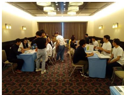
奈良・奥大和各市町村合同移住セミナー（大阪）