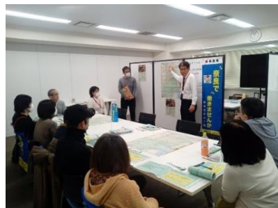
奈良で働くセミナー・相談会（東京）