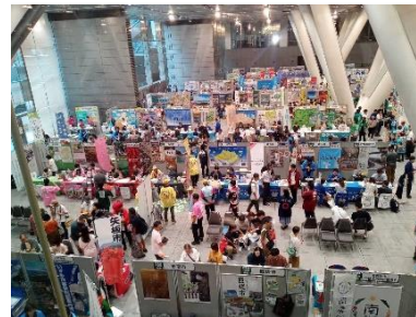
会場 東京国際フォーラム ホール