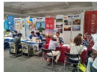
会場 天満橋OMMビルホール