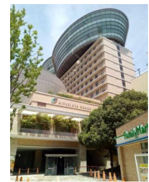
シティプラザ大阪