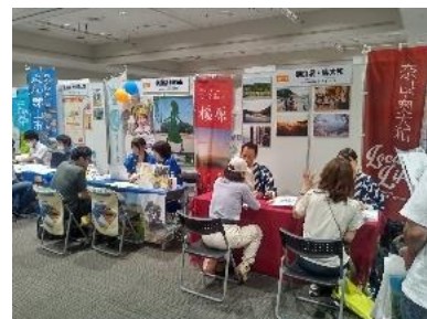
会場 天満橋OMMビルホール