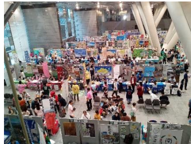
会場 東京国際フォーラム ホール