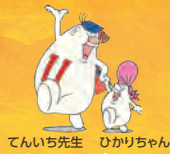
てんいち先生 ひかりちゃん