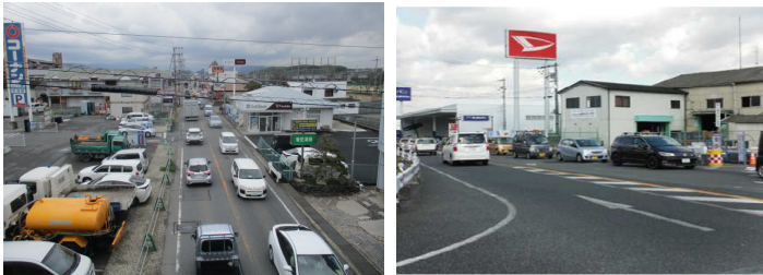
現道の渋滞状況写真

○4車線化整備により、一般国道25号、西名阪自動車道、中和幹線を繋ぐ南北方向の交通円滑化を図る。