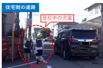
朝の通学状況写真

○4車線化および歩道の整備により、幹線道路の円滑な交通が確保されることで、生活道路・通学路への抜け道利用の減少が期待でき、交通安全性が向上。