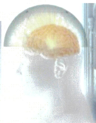
ホスレボドパ ホスカルビドパ水和物 持続皮下注射療法 CSCI