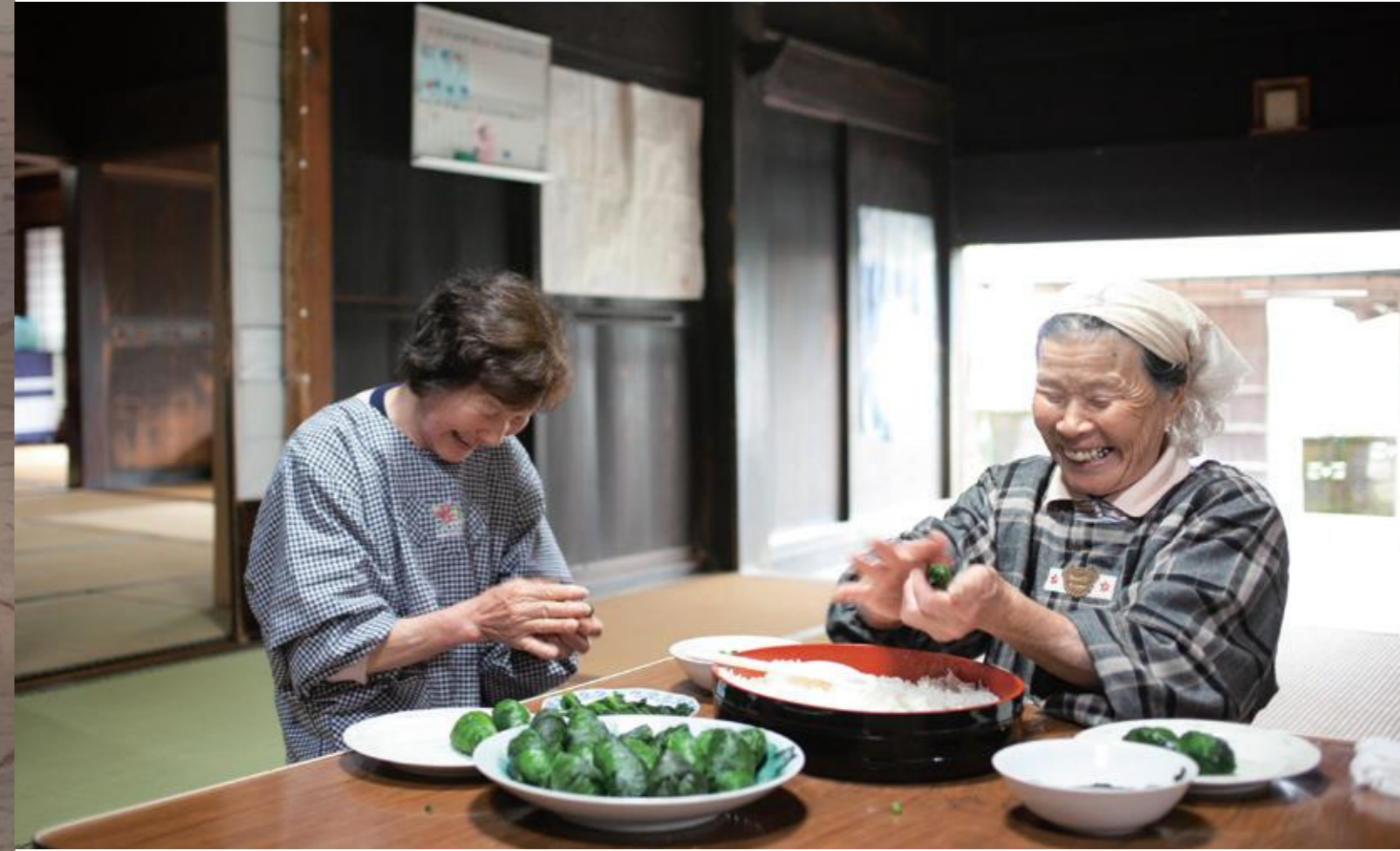
今号の奥大和の風景 十津川村の山天集落